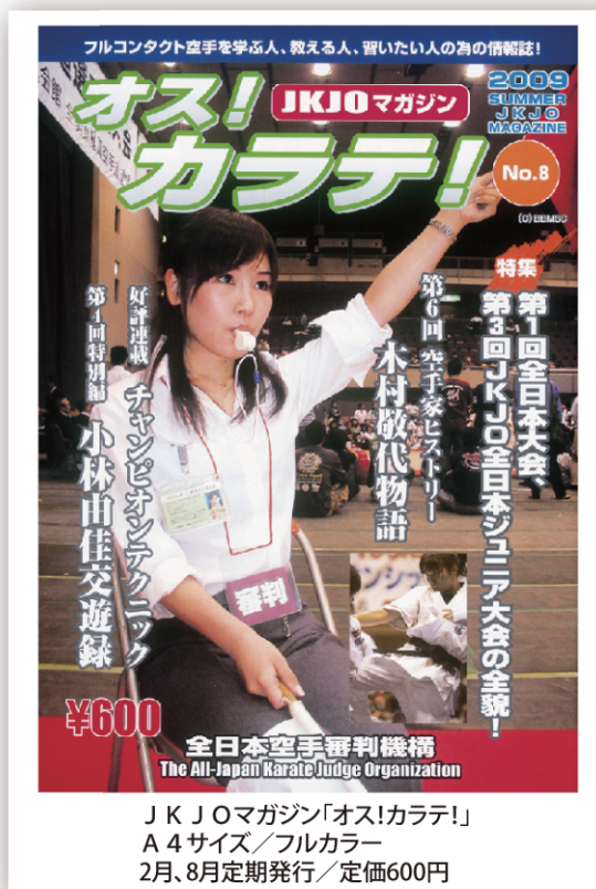
JKJOマガジン「オス!カラテ!」 A4サイズ/フルカラー 2月、8月定期発行/定価600円

JKJOマガジン「オス!カラテ!」は、より一層の内容の充実と、JKJOに関わる皆様に親しまれる情報誌となるべく、今号から内容を一新し、全ページフルカラーでリニューアルいたします。各道場の情報や合宿、審査会、選手紹介、イベントなどを、「オス!カラテ!」で全国に発信し、道場の活性化や選手のモチベーション向上に役立ててください!